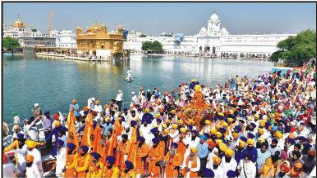
ਸ੍ਰੀ ਗੁਰੂ ਰਾਮਦਾਸ ਜੀ ਦੇ ਪ੍ਰਕਾਸ਼ ਦਿਵਸ ਨੂੰ ਸਮਰਪਿਤ ਸਜਾਏ ਕਰਦੇ ਨਗਰ ਕੀਰਤਨ ਦਾ ਅਲੌਕਿਕ ਦ੍ਰਿਸ਼। (15 ਅਕਤੂਬਰ 2016)